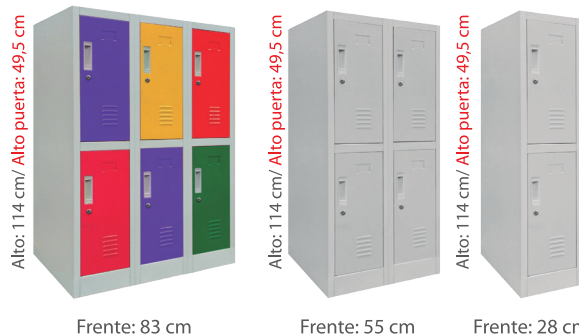
OLMN3-02* OLMN2-02 OLMN1-02

* imagen demostrativa con puertas de colores